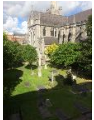
Ausblick auf die St. Patrick's Cathedral

Während meiner zweiten Woche konnte ich viele weitere Details kennenlernen, z. B. wie die Bestände instandgehalten werden. Das geschieht in dem sogenannten „Conservation Lab“. Dort werden unter anderem die Stützen der Bücher für die Ausstellungen hergestellt. Jede wird einzeln maßgeschneidert und mit Hilfe einer Tabelle des Trinity College berechnet, das Material komplett säurefrei. Wenn ein Buch besonders stark verschmutzt ist, es Schimmel aufweist oder es einen Fall von Säurefraß gibt, wird es in einem speziellen Becken gewaschen und in konservierenden Chemikalien eingelegt. Wenn Stücke einer Seite fehlen oder sie gar komplett herausfällt, werden die jeweiligen Einzelteile sorgfältig aus farblich übereinstimmenden Japanpapier