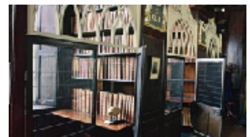
Käfige der zweiten Galerie