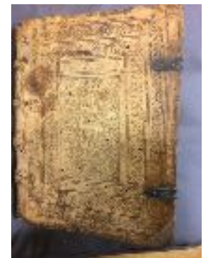
Einband der Chronica Caronis

Besonders gefallen hat mir das praktische Arbeiten mit einem der alten Bücher. „Chronica Caronis“ von Philippo Melanthon, geschrieben in 1526 ist ein deutsches Buch in Fraktur. Ich sollte es auf verschiedenste Gebrauchsspuren analysieren und diese dokumentieren, damit sie der Katalogaufnahme hinzugefügt werden können.