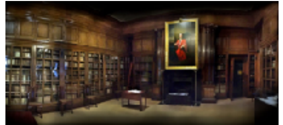
Edward Worth Library